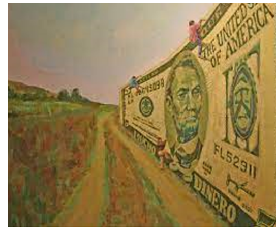
Photos et texte L. PHEBE (élève) (Lycée Robert WEINUM- La Savane Saint Martin)

Later on he explained to us with great detail the meaning behind our favorite art works of his, such as: Moses Parting the Rio , Draining Migrant's Life Blood , What would Lincoln say and much more.