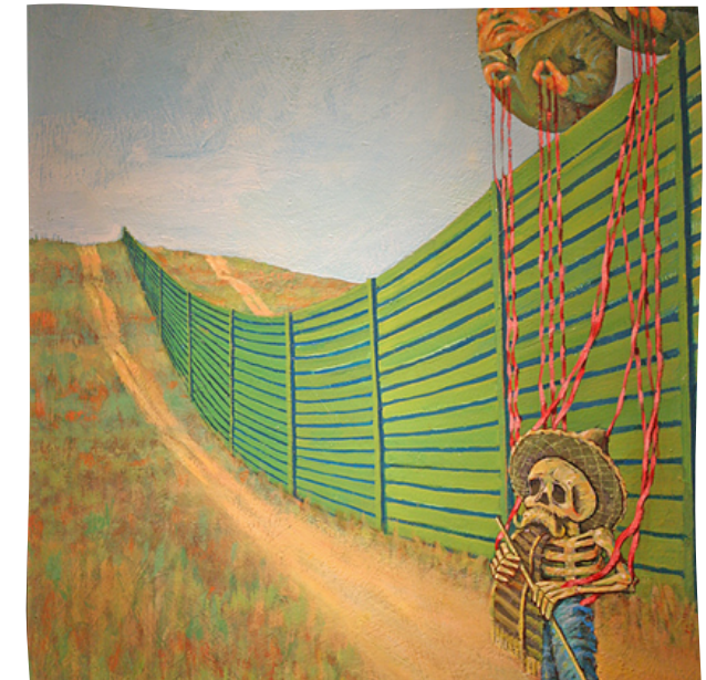
Photos et texte GUY Océane (élève) (Lycée Robert WEINUM- La Savane Saint Martin)