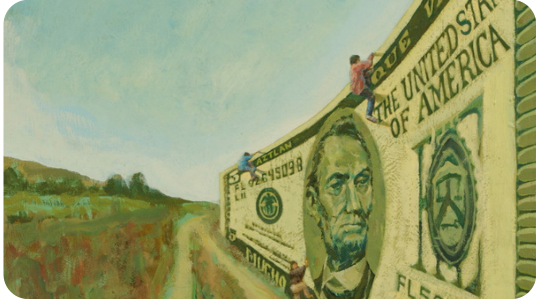
"What would Lincoln Say?" (or Qué Lincoln Diria?)