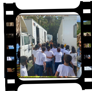
Visite des loges des acteurs