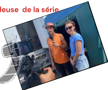
Les producteurs de la série